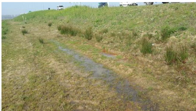
Foto: verzadiging teen talud.

Het opleidingssysteem borgt dat inspecteurs (intern of extern) worden bijgeschoold als AS SIKB 6900 inhoudelijk wordt gewijzigd.