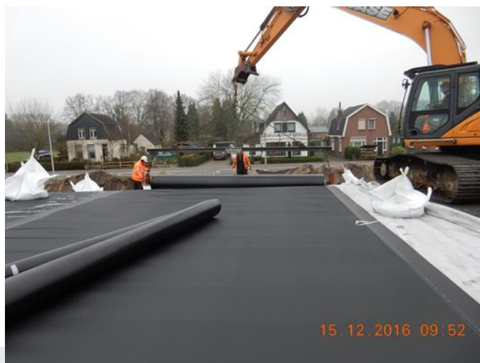
Foto: aanbrengen HDPE-Folie